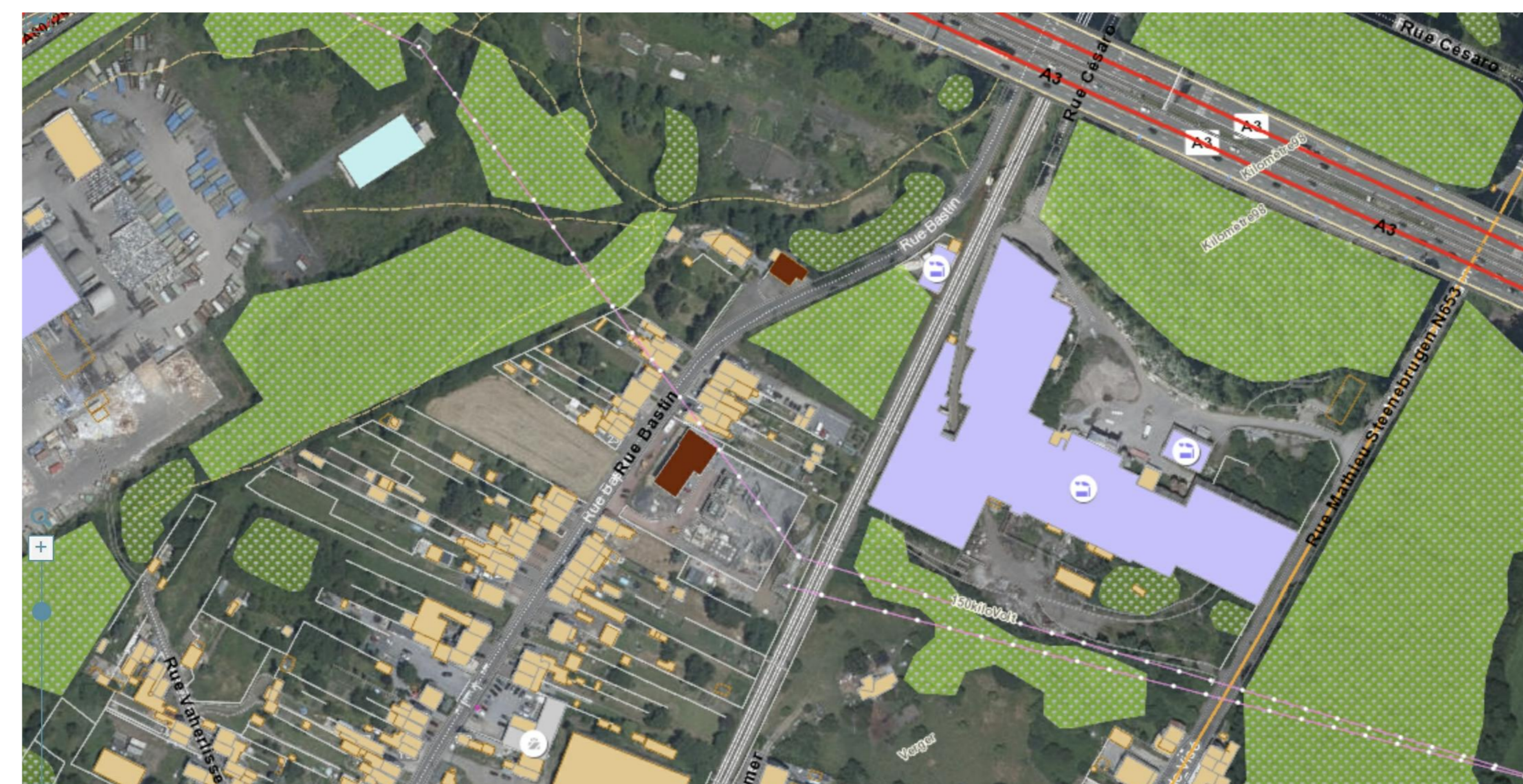
Contexte urbain et paysager / affectations 1/2000