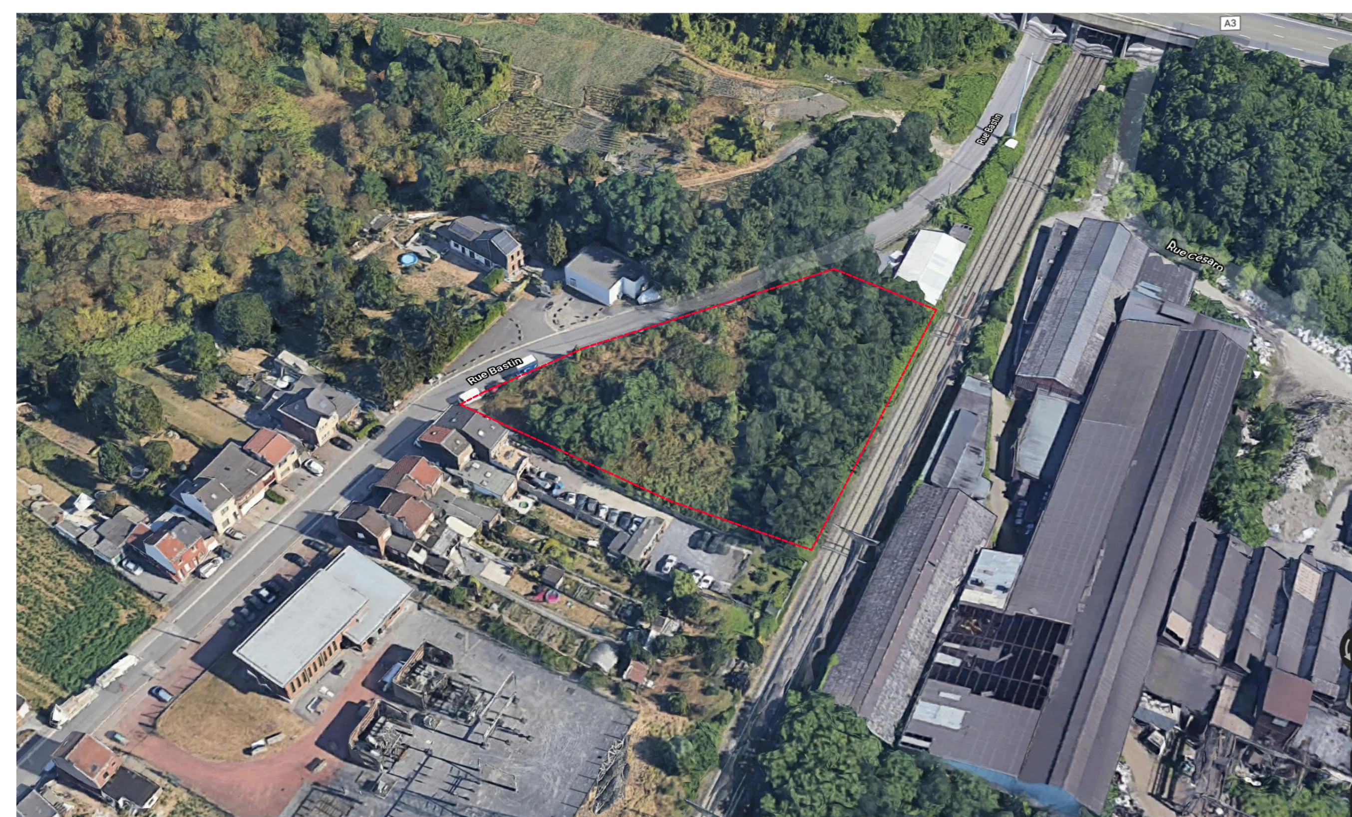
Vue aérienne 1/2000

Plantation en quinconce et en bouquets de 4 à 6 plants de même espèce de façon à former abriement et un massif végétal d'aspect naturel.