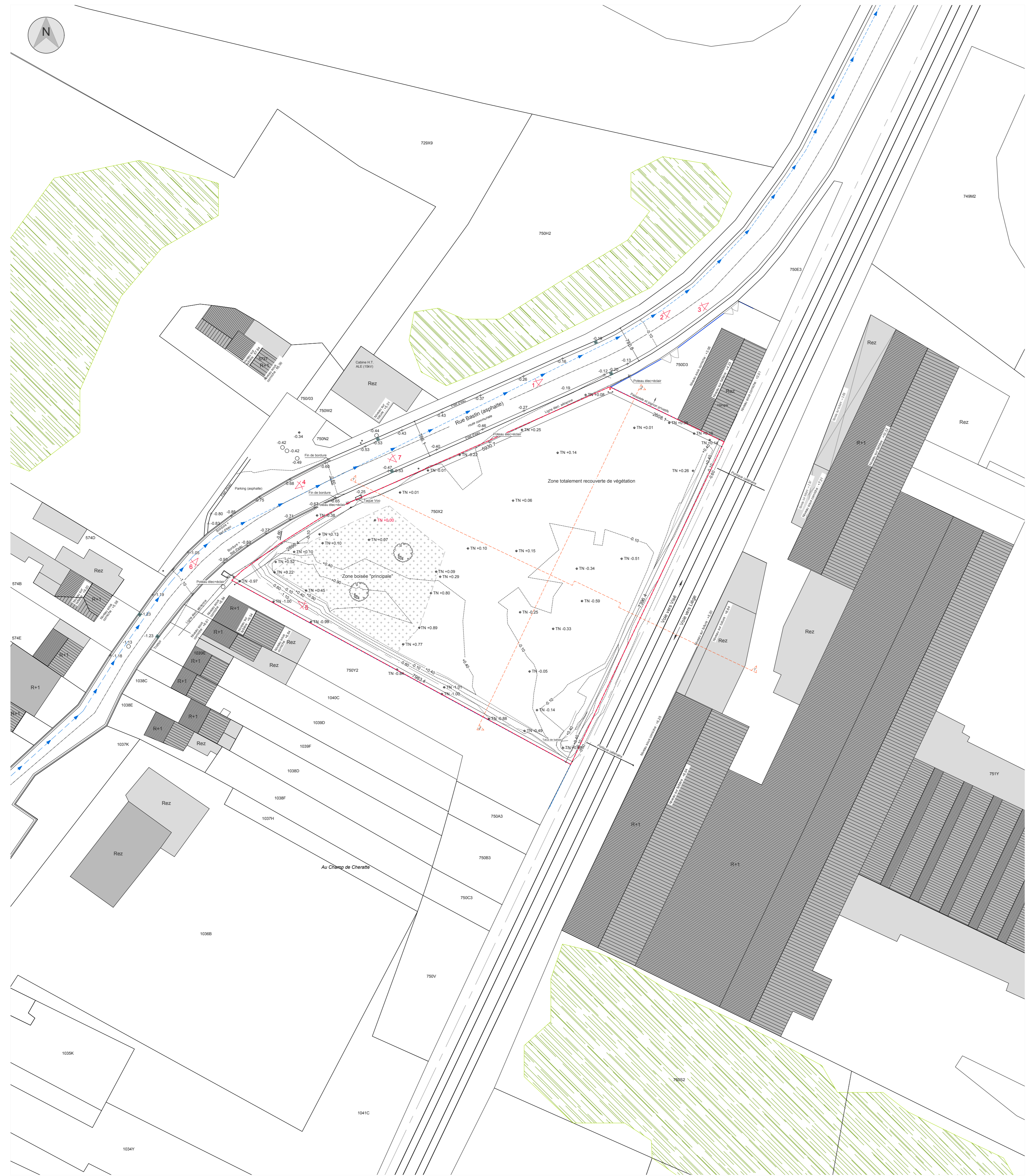
Impantation Situation existante 1/500